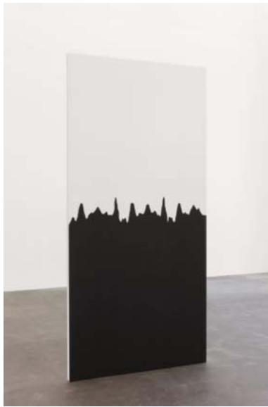
LAWRENCE ABU HAMDAN Beneath the Surface, 2015