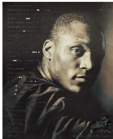
NATALIE CZECH A poem by repetition by Vsevolod Nekrasov #2, 2015