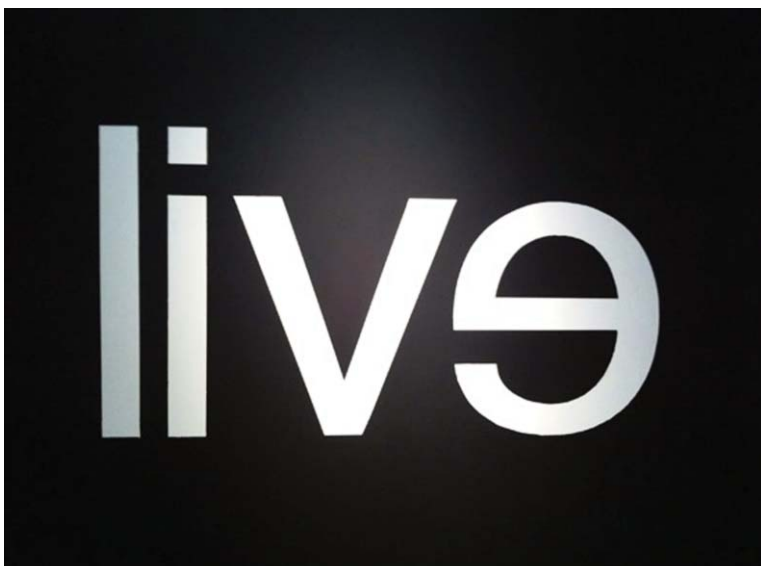
KENDELL GEERS Evil : Live, 2002