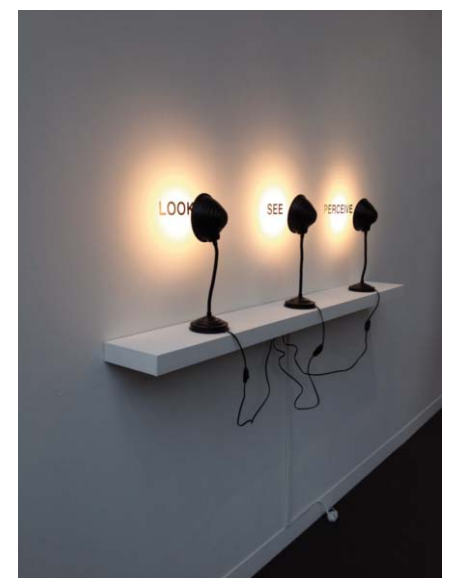
ANTONI MUNTADAS Regarder, voir, percevoir, 2009