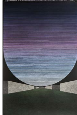
Seeking Eden , 2014 fusain et pastel sur papier / charcoal and pastel pencils on paper 101,3 x 154 cm