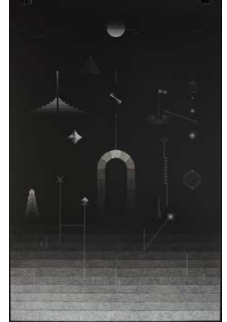
Lunar Trials , 2014 fusain et pastel sur papier / charcoal and pastel pencils on paper 101,3 x 154 cm Collection Jean Marc Decrop