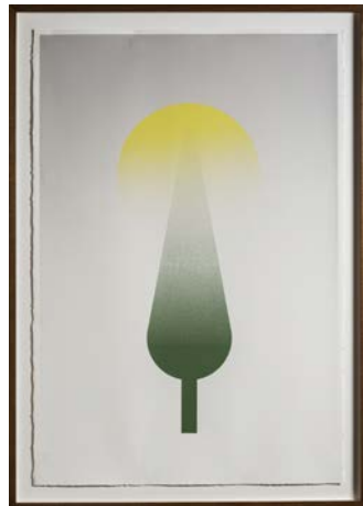
Toward Light , 2013 sérigraphie / screen print on paper 112,5 x 76,5 cm