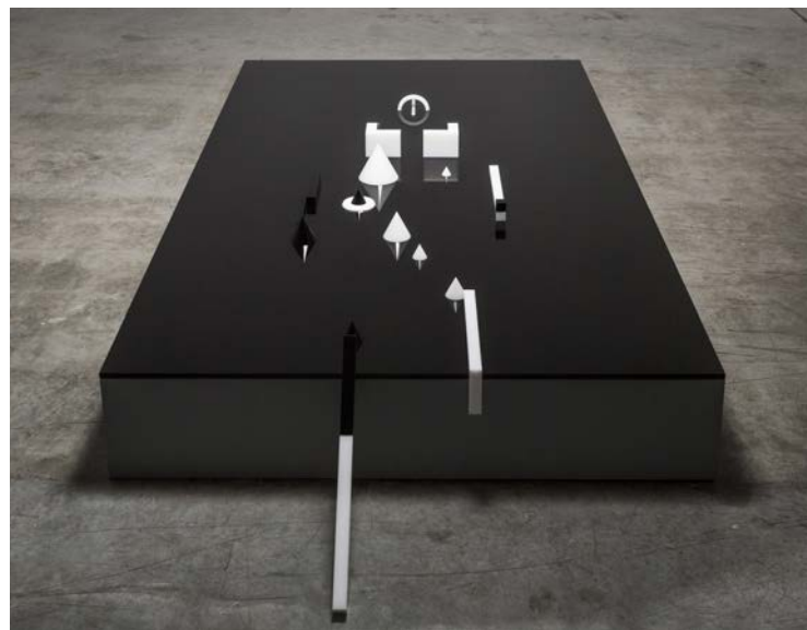
Residuum , 2014 techniques mixtes / mixed media, dimensions variables / variable dimensions.