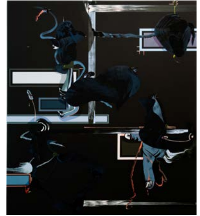
FIONA RAE Astronaut , 1998 huile et acrylique sur toile, 243,8 x 213,4 cm. Acquis en 2003 avec l'aide du FRAM © F. Rae.