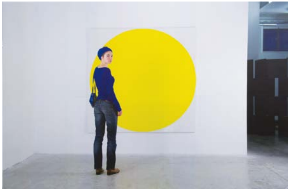
RYAN GANDER The Conceptual Cul de Sac , 2012, détail série de 9 pages encadrées prenant la forme de diverses pages de magazines d'art, 46 x 63 x 4 cm. Acquis en 2012 avec l'aide du FRAM © R. Gander