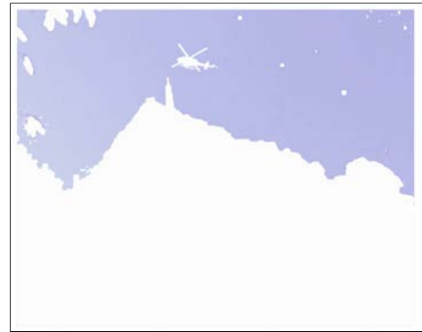
WALID RAAD Cotton under my Feet , 2011 ensemble de 96 impressions jet d'encre sur papier velours, édition 1/7 + 2 EA, 23,4 x 29,8 cm Don de la Clarence Westbury Foundation en 2013 © W. Raad