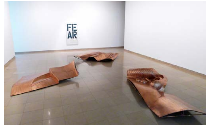
DANH VO We the People , 2011 ensemble de 3 sculptures d'après la statue de la liberté de Bartoldi, cuivre, dimensions variables. Dépôt du Fonds National d'art contemporain © D. Vo (au fond, Christopher Wool, Sans titre , 1990)