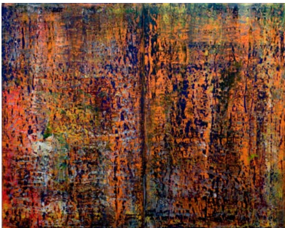
GERHARD RICHTER Abstraktes Bild , 1989 huile sur toile, 320 x 400 cm Acquis en 1991 avec l'aide du FRAM © G. Richter. Photo D. Huguenin