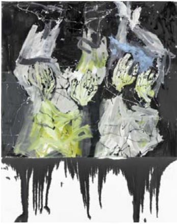
GEORG BASELITZ Zwei Schwarz Russen , 2010 huile sur toile, 250 x 200 cm Dépôt d'une collection particulière © G. Baselitz